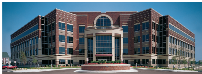
Primera Technology, Inc. É.-U.A.