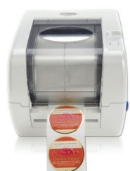
FX400e FOIL IMPRINTER

Le Distributeur d'étiquette de DX850e automatiquement distribue et présente étiquettes auto-adhésives une à une. Il remplace la prise manuelle d'étiquettes, rendant votre chaîne de production plus rapide et plus efficace.