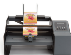
DX850e LABEL DISPENSER

Les Applicateurs d'étiquette semi-automatique AP-Séries sont la parfaite solution pour les récipients cylindriques et autres formes effilées, tels des bouteilles, bidons, fioles et tubes.