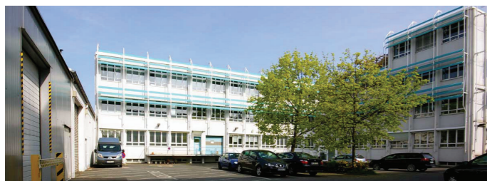
Primera Technology Europe, Allemagne

Primera Technology est un des fabricants leader d'imprimantes spécialisées. Nous avons produit plus d'un million d'imprimantes à transfert thermique, jet d'encre ou matricielle au cours de notre histoire. Vous pouvez être assuré en toute confiance que votre nouvelle imprimante d'étiquettes couleurs Primera vous donnera des années de satisfaction et de performances. Le meilleur de tous, le LX900e livre vraiment résultats professionnels à un prix accessible !