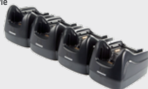
• 94A150037 Puits chargeur 4 positions • 94A150038 Puits Ethernet 4 positions